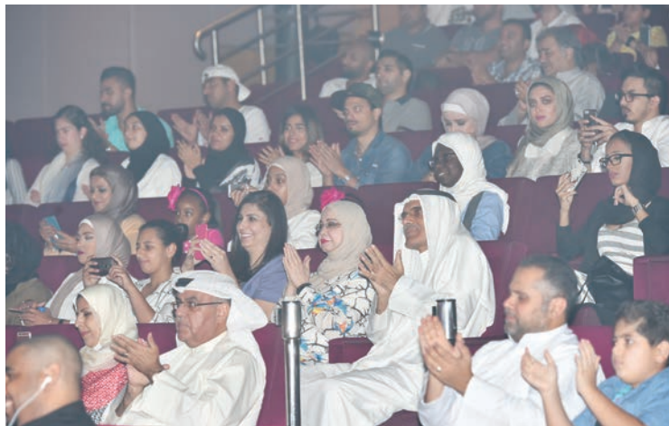
جانب من الجمهور