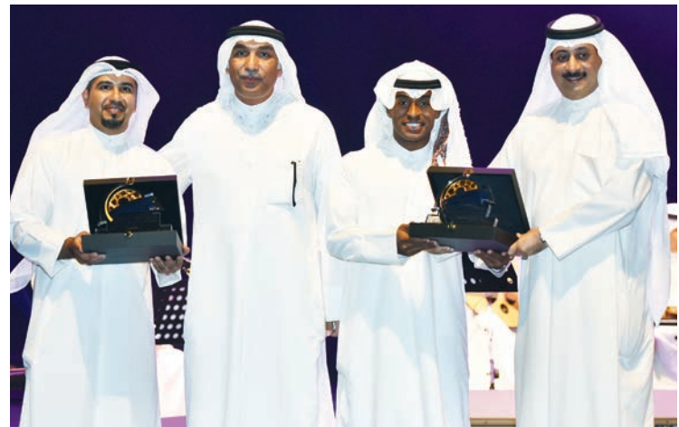
د. الدويش والمسعود يكرمان نجما الحفل